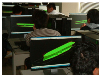
船舶 3 次元 CAD