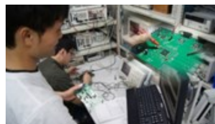
電気特性の評価風景

http://www.elc.nias.ac.jp/kiyoyama/kklab/index.htm